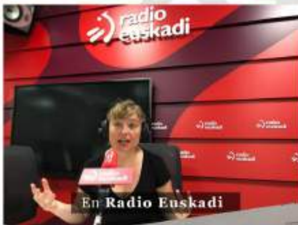
En Radio Euskadi